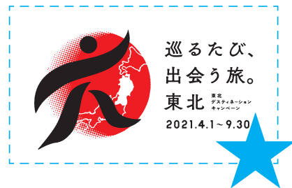
■保護エリア内への要素の追加