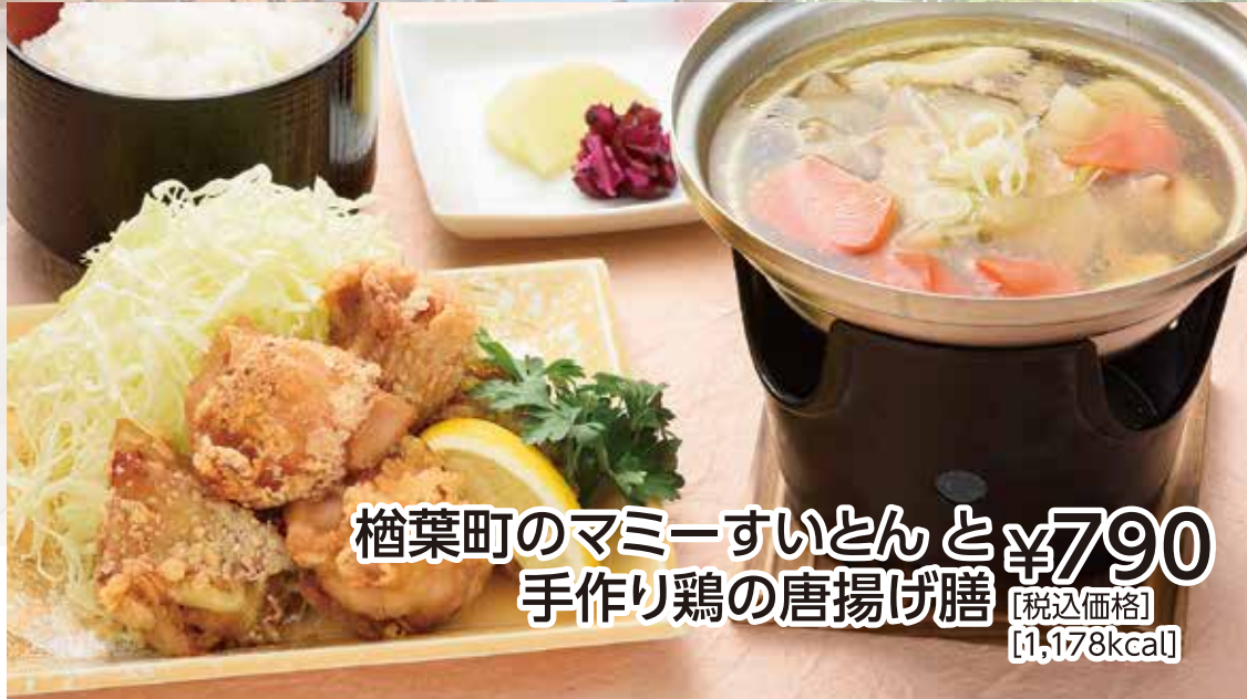
檜葉町のマミーすいとんと ¥790 手作り鶏の唐揚げ膳 【税込価格】 【1,178kcal】

2002年日韓W杯サッカー日本代表・合宿の地だった「ヴィレッジ」で トルシエ監督(当時)が「故郷のおばあちゃんの味」と 評したことから「マミーすいとん」と命名された名物料理