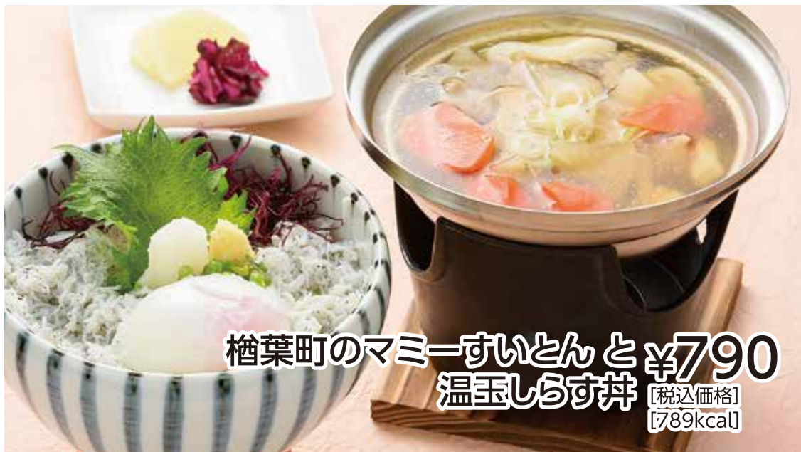
檜葉町のマミーすいとんと ¥790 温玉しらす丼 【税込価格】 【789kcal】

2002年日韓W杯サッカー日本代表・合宿の地だった「ヴィレッジ」で トルシエ監督(当時)が「故郷のおばあちゃんの味」と 評したことから「マミーすいとん」と命名された名物料理