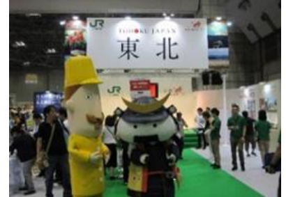
【東北ブースの様子】

「まだ見たことのない東北の四季」をメインテーマに、JR東日本と連携したブース内に東北6県と新潟県のコーナーを設けて、各県が趣向を凝らした情報発信を行い、オール東北ブースとして一体感のある情報発信を行いました。週末の一般公開日は、ステージイベントとして各県郷土芸能や観光PR、ブース内での地酒試飲会などに多くの人が集まり、終日大盛況でした。