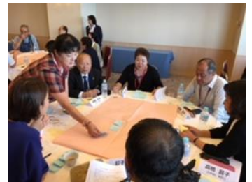
【グループ討議の様子】

また、この研修会で議論された内容等を、2018年10月13日（土）に、東京ビッグサイトで行われた「ぼうさいこくさい2018」にて紹介しました。