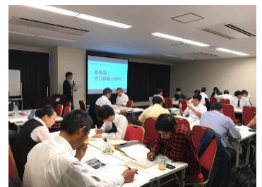
【ワークショップの様子】