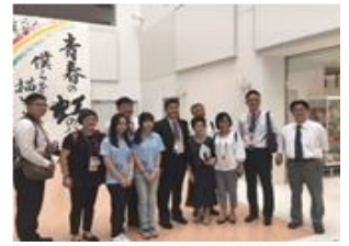
【高校を視察する参加者】

招請期間中には、今後の学校交流につなげるため、仙台市内の学校を視察したほか、宮城県内の高校の校長方との意見交換会を実施し、相互交流の拡大について活発な意見が交わされました。