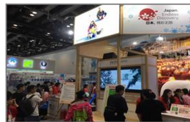
【日本ブースの様子】

2022年に北京で開催される冬季オリンピック・パラリンピックの成功に向けて、中国政府ではスキー人口の底上げに取り組んでおり、スキー場が少なくシーズン中は料金が高騰する中国国内よりも、他国よりも行きやすい日本へのスキー誘客は大いに期待できるという手応えを得ました。