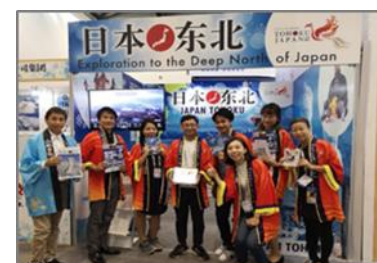
【東北から参加した面々】