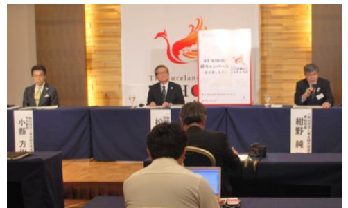
【記者発表 絆キャンペーンの説明】

まずは、東北・新潟域内の観光需要の早期回復を目的に、自治体や関係事業者と連携し「東北・新潟応援！絆キャンペーン～旅を楽しもう～」を実施します。