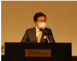
【小縣特別顧問挨拶】

その後、新役員体制および「東北・新潟応援！絆キャンペーン～旅を楽しもう～」に関する記者発表を行いました。