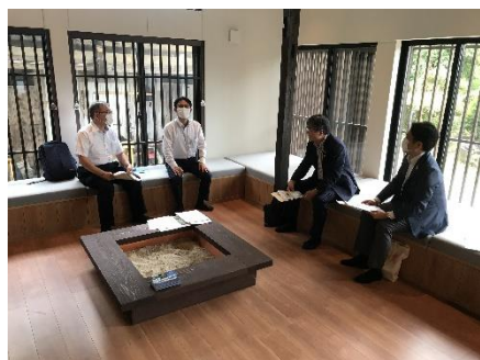
【世界遺産平泉・一関DMO】

各DMOからはコロナ禍で事業展開する上での課題や、先を見据えた地域コンテンツ開発の取組みなど、対面でしか聞けない大変貴重なお話をいただきました。今後も域内DMOとの意見交換を実施し、東北広域連携の強化を図ってまいります。