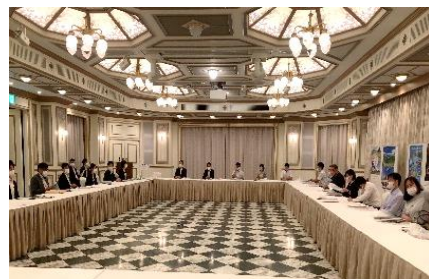
【学校関係者相談会】