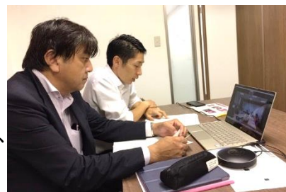
【オンライン会議の様子】

現地旅行会社からは、「台湾での訪日旅行に係る需要は新型コロナウイルス前後で変わらないと思う」「一方、東北の感染者が仮にゼロになっても、日本全体で新型コロナウイルスが収束しないと渡航できないと思う」「台北-仙台便、青森便、花巻便の運休が長期化する場合は、東北への旅行商品造成は難しいと思う」といった声が寄せられました。今後も引き続き意見交換会を実施するとともに、収集した情報を各種事業へ反映させ、より確度の高い事業を展開してまいります。