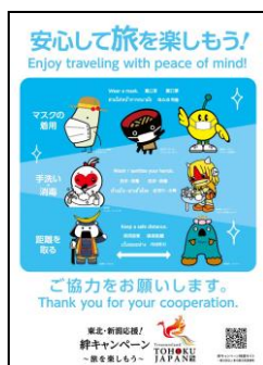
【呼びかけポスター】