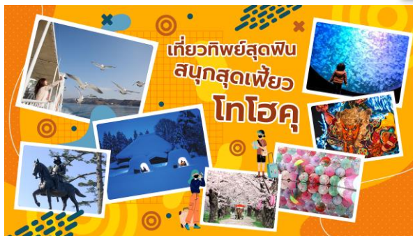
イベントキービジュアル