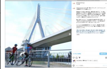
【むつ湾サイクリング】