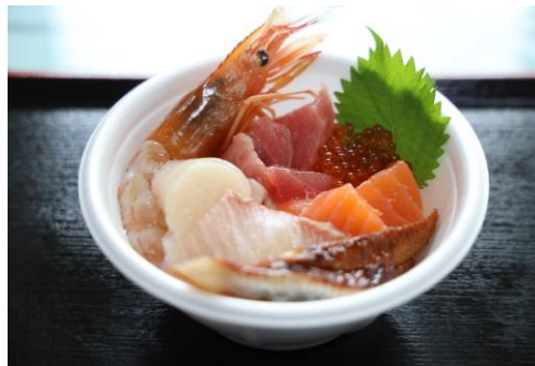
写真：海の幸（イメージ）