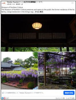
【北方文化博物館（新潟県）】