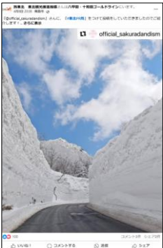
【八甲田・十和田ゴールドライン 雪の回廊（青森県）】

東北の観光に関係する投稿の際には、ぜひ「#東北PR局」をつけてご投稿ください。「#東北PR局」をつけて投稿いただいたものの中から、素敵な投稿をリポストさせていただきます。（リポスト前にはメッセージで許諾を取らせていただきます）