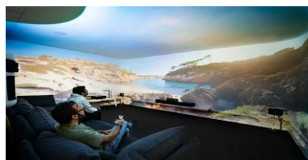
【VR動画シアターイメージ】