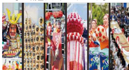
【絆まつりイメージ】