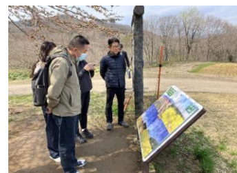
【やくらいガーデン視察】