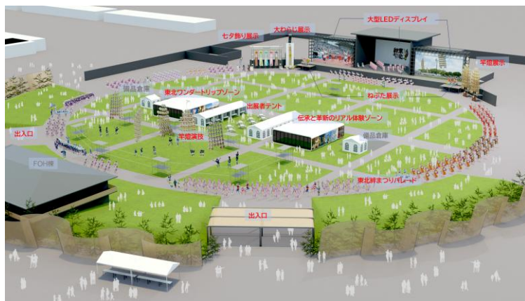
【アリーナMatsuri会場イメージ】

※東観推の会員の皆様、この旅東北NEWSを御覧の皆様で、「大阪・関西万博」に行く予定の皆様は、この機会と一緒に万博会場で東北プロモーション・東北絆まつりの応援をお願いいたします。 御来場をお待ちしております。