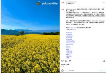
【三ノ倉高原花畑（福島県）】