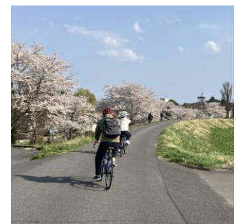
【加美町中新田でのロードバイク体験】