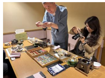
【稲住温泉での夕食の様子】