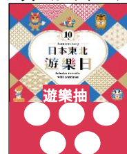
※ラリーカードイメージ

イベント開催中入口にて混雑状況を確認しながら、不定時にスタンプラリーカードを配布。 指定数のミッションをクリアした来場者はガラボン抽選で、オリジナルのグッズが当たります。 協賛社様（参加ブース）はそれぞれ自由にミッションを設定し、クリアした方にスタンプを押します。 （ミッション例：SNSページへいいねなど、ご自由に設定ください）