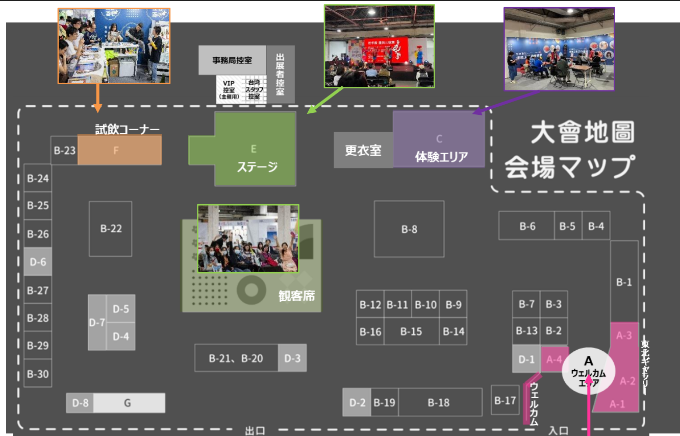
■ブースエリアの様子