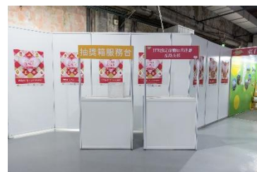
▲カウンター出展のイメージ