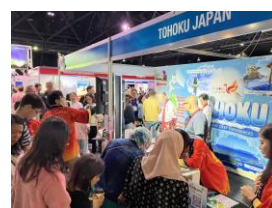
【東北ブースの様子】

日本へのスキー旅行人気はますます高まっており、今後も東北一体となったプロモーション強化を図り、更なる誘客に努めてまいります。