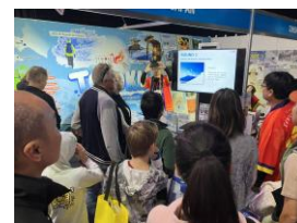
【クイズ大会の様子】