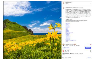
【大野亀のトビシマカンゾウ (新潟県)】