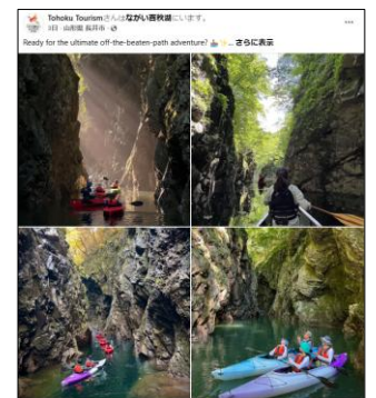
【三淵溪谷カヌーツアー (山形県)】