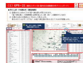
【研修資料から抜粋】

今後も東北観光DMPを利用した施策展開を支援するため、研修会の開催などを通じたデータ分析手法の浸透を図ってまいります。