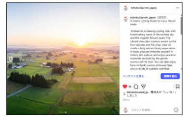
【栗石さんぽ・サイクリング (岩手県)】