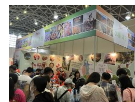
【東北ブースの様子】

台湾・高雄で開催された高雄市旅行公会国際旅展に、東観推、東北6県、仙台市とともにブース出展を行いました。高雄-仙台直行便就航後初の現地出展であり、東観推としても9年ぶりの高雄での旅行博の実施となりました。台湾北部に比べ東北の認知度がまだ高くない南部の高雄にて、直行便という追い風を活かし、さらなる誘客拡大と東北の魅力発信強化に取り組んでまいります。