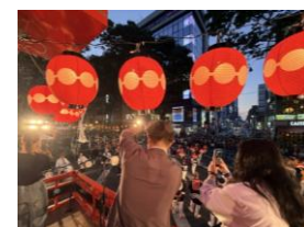
【仙台・青葉まつり】

今後は、8月開催予定のバンコク日本博において旅行商品の販売を行い、市場の反応を確認するとともに、その結果も踏まえながら、タイ国内における旅行博や訪日旅行フェア等での販売を通じ、実際の送客に繋げてまいります。