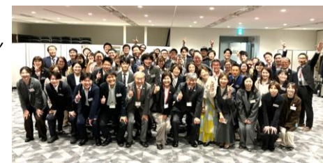
【フェニックス塾だよ、全員集合！】