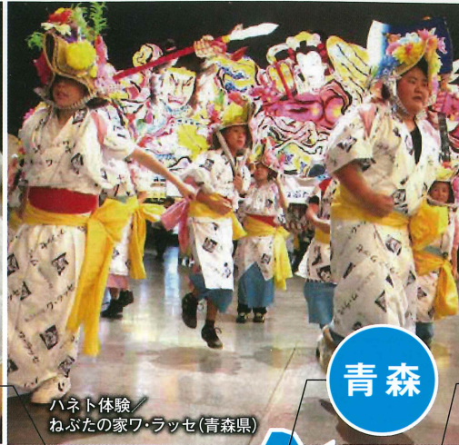
ハネト体験 ねぶたの家ワ・ラッセ(青森県)