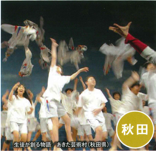
生徒が創る物語 / あきた芸術村(秋田県)