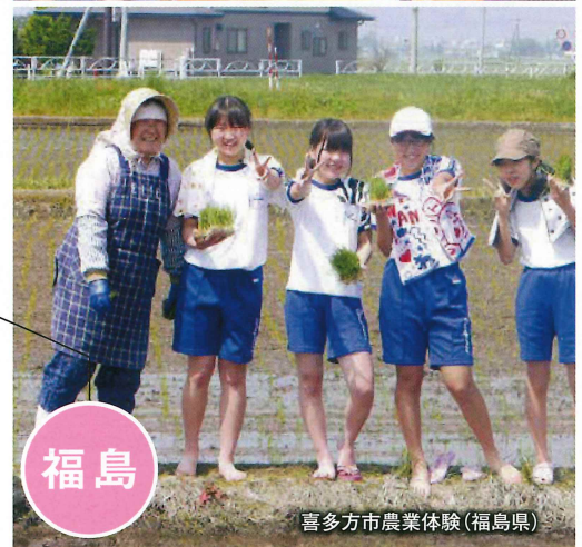
喜多方市農業体験(福島県)