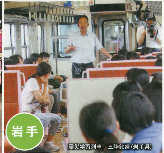
震災学習列車 / 三陸鉄道(岩手県)