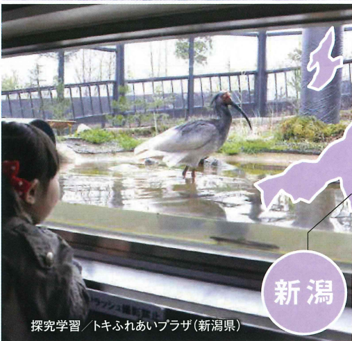
探究学習 / トキふれあいプラザ(新潟県)