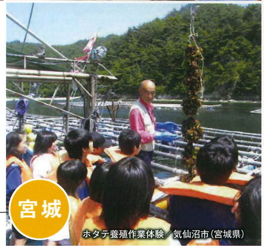
ホタテ養殖作業体験 / 気仙沼市(宮城県)