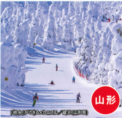
「樹氷」ができるメカニズム / 蔵王(山形県)