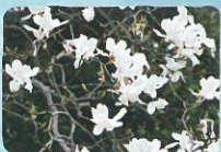
コブシ 奥岳～薬師岳