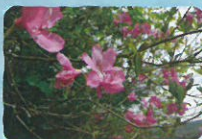
ヤシオツツジ 薬師岳・勢至平・ あだたら溪谷自然遊歩道