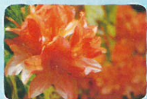
レンゲツツジ 勢至平