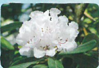
ハクサンシャクナゲ 奥岳～薬師岳・勢至平