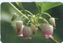
ウラジロヨウラク 薬師岳～安達太良山・ 勢至平