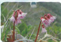
イワカガミ 薬師岳～安達太良山