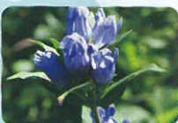
リンドウ 薬師岳・勢至平