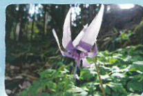
カタクリ 奥岳周辺