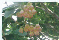
サラサドウダン 薬師岳～安達太良山・ 勢至平