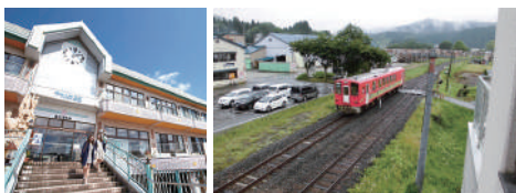
クウインズ森吉 阿仁前田 宿泊室からの眺め

大人気の「もちもち三角バター餅」や柔らかくて芳醇な「馬肉シチュー」、内陸線オリジナルグッズなどが購入できるサイトです。 ●問 / 0186-82-3231 (秋田内陸縦貫鉄道株式会社) ●URL / https://nairiku.shop-pro.jp/