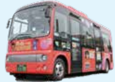
青森市シャトル・ルートバス 「ねぶたん号」全線