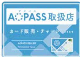
AOPASS取扱店ステッカー