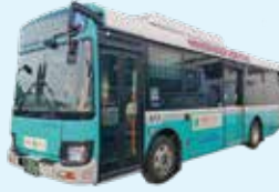
青森市市バス全線