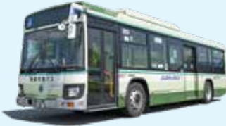
青森市営バス全線